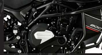
Defensas bajas y altas de serie