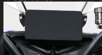
TFT a color