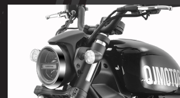
Iluminación Full Led y TFT