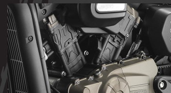
Motor de dos cilindros en línea V