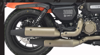
Doble salida de Escape