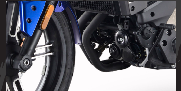
2 cilindros en línea