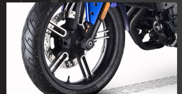
Rines que acompañan el diseño de la moto